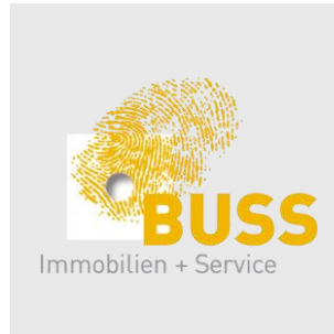
Buss Immobilien und Service, Pratteln