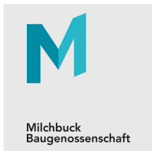
Milchbuck Baugenossenschaft, Birmensdorf

«Termine und Budget wurden von Asept Business Software exakt eingehalten. Explizite Anerkennung gab es dafür auch von unserem Verwaltungsrat. Sowohl mit unserem Systempartner als auch mit der Lösung sind wir äusserst zufrieden.»