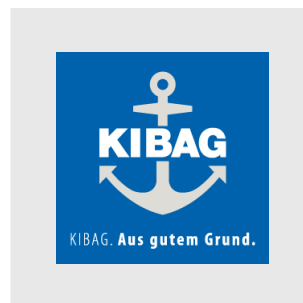
KIBAG Gruppe (ganze Schweiz)