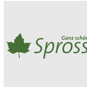
Spross Gruppe, Zürich

«Termine und Budget wurden von Asept Business Software exakt eingehalten. Explizite Anerkennung gab es dafür auch von unserem Verwaltungsrat. Sowohl mit unserem Systempartner als auch mit der Lösung sind wir äusserst zufrieden.»